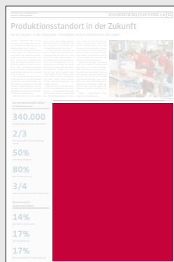
Juniorpage 202 x 265 mm

Preis € 12.690,- Vorteilspreis € 8.883,-