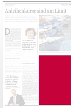
1/4 Seite 134 x 200 mm

Preis € 2.538,- Vorteilspreis € 1.776,60