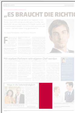
Steckbrief 1-spaltig 51,2 x 100 mm