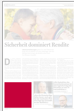
Steckbrief 2-spaltig 106,4 x 100 mm

Preis € 2.538,- Vorteilspreis € 1.776,60