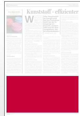
1/3 Seite 272 x 135 mm

Preis € 6.345,- Vorteilspreis € 4.441,50