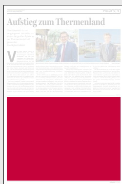
1/2 Seite 272 x 200 mm

Preis € 8.565,75 Vorteilspreis € 5.996,02