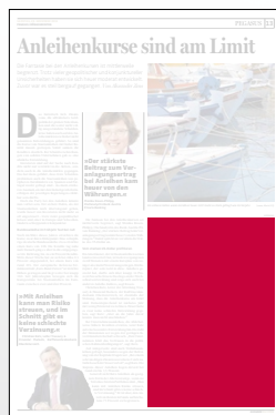
1/4 Seite 134 x 200 mm

Preis € 2.538,- Vorteilspreis € 1.776,60