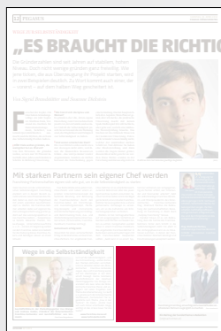
Steckbrief 1-spaltig 51,2 x 100 mm