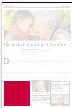
Steckbrief 2-spaltig 106,4 x 100 mm

Preis € 2.538,- Vorteilspreis € 1.776,60