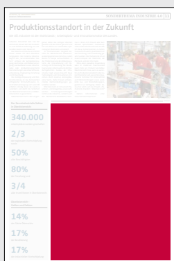
Juniorpage 202 x 265 mm

Preis € 12.690,- Vorteilspreis € 8.883,-