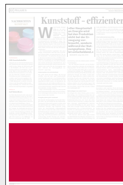
1/3 Seite 272 x 135 mm

Preis € 6.345,- Vorteilspreis € 4.441,50