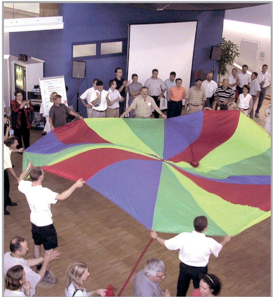
Konstruktive Teamarbeit bringt gute Ergebnisse und macht auch Spaß.

Ziel dieses Projektes war der gemeinsame Aufbau von Führungskompetenz in Kunststoff und Holz verarbeitenden Betrieben in der Region Innviertel. Basierend auf einer Evaluierung des Bildungsbedarfs der teilnehmenden Betriebe sollten Lehrinhalte fixiert und entsprechende Referenten gesucht werden. Nach den branchenspezifischen Schulungen sollte das Gelernte in Projekten im jeweiligen Unternehmen gefestigt werden. Der Inhalt sollte gemeinsam erarbeitet und bei Bedarf auch geändert werden.